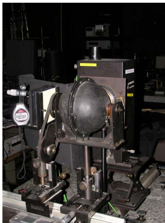
Rys. 1. Układ do wzbudzenia świecenia materiałów fosforescencyjnych

W oparciu o wyżej wymienione wymagania zbudowano w Laboratorium Fotometrii i Radiometrii układ do wzbudzenia materiałów fosforescencyjnych (rys. 1.) w skład którego wchodzi źródło wzbudzenia, kula fotometryczna i luksomierz oraz stanowisko do pomiaru bardzo niskich wartości luminancji (rys. 2.) za pomocą fotometru Pritchard.