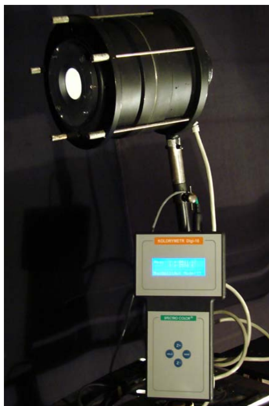
Rys. 2. Kolorymetr DIGI 03