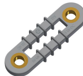
Izolatory sprężawkowe ITS