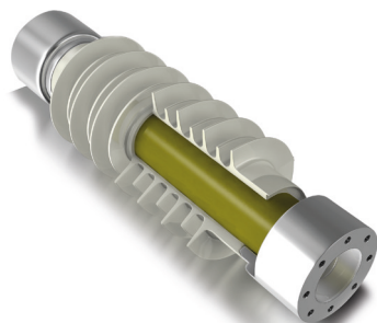
Kompozytowe izolatory ostonowe