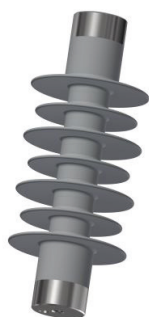
Izolatory aparatuowe KWIS