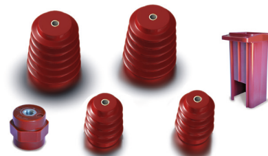
Izolatory epoksydowe LTE