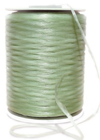
Taśma TSE 200