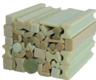
Profile szkło epoksydowe